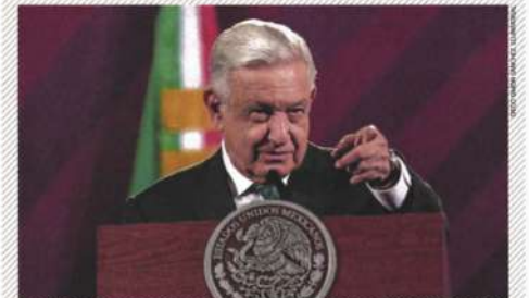
El presidente Andrés Manuel López Obrador argumenta que los autoridades del Poder Judicial de la Federación le atribuyen expresiones que no dijo durante sus conferencias sobre Xóchitl Gálvez.

El jefe del Ejecutivo federal exhibe a los integrantes del Tribunal Electoral, a los magistrados, porque en su opinión injerentes, calumniosos, actúan de manera falaz, y son capaces de alterar su palabra.