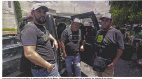
Autodefensas del transporte público inician "patrullajes" en Ecoterm Choferes hacen rondines de vigilancia para evitar extorsiones y asaltos.