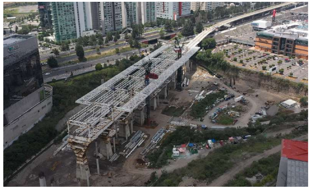
Estación Santa Fe | obra civil agosto 2023 | 220 m longitud