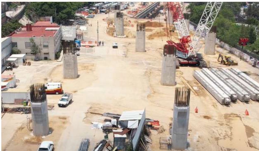
Viaducto Observatorio | noviembre 2023 | 162 m de longitud