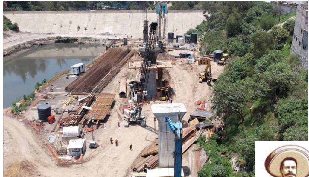
Doble voladizo Presa Tacubaya | octubre 2023 | 520 m