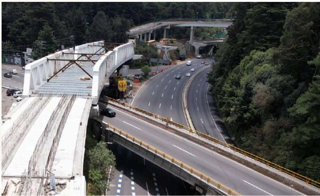
Celosía 1 y 2 agosto | agosto 2023