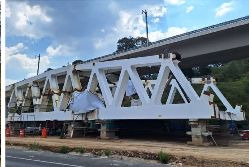
Ensamble de la Secuencia 3 de la Celosía 2