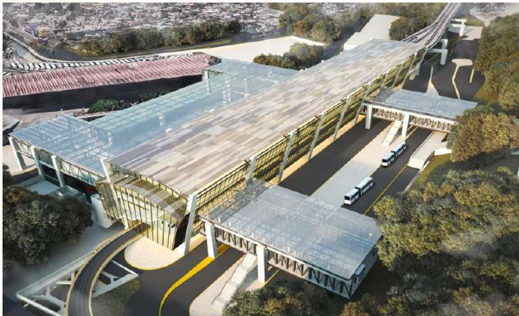
Imagen objetivo Estación Observatorio