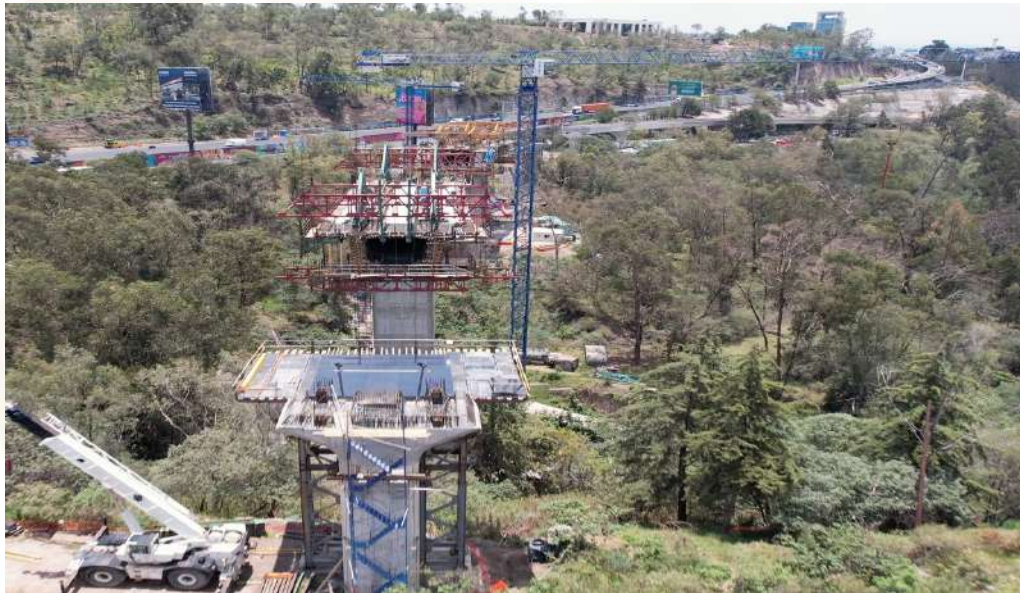
Doble voladizo Hondonada | octubre 2023 | 320 m longitud