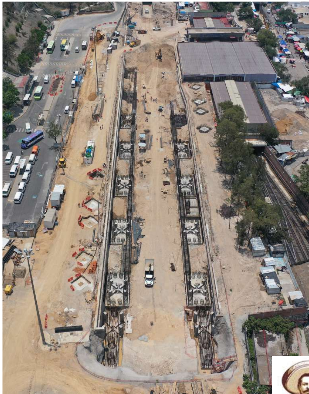
Estación Observatorio | diciembre 2023 | 52% avance