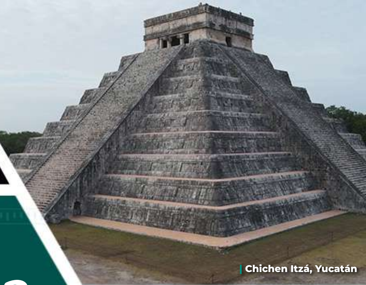
Chichen Itzá, Yucatán