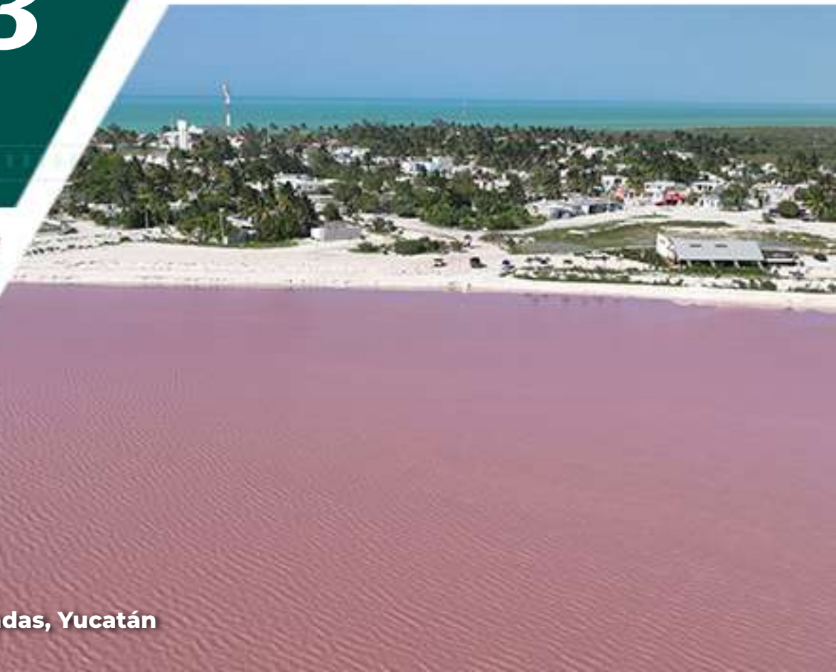
Las Coloradas, Yucatán