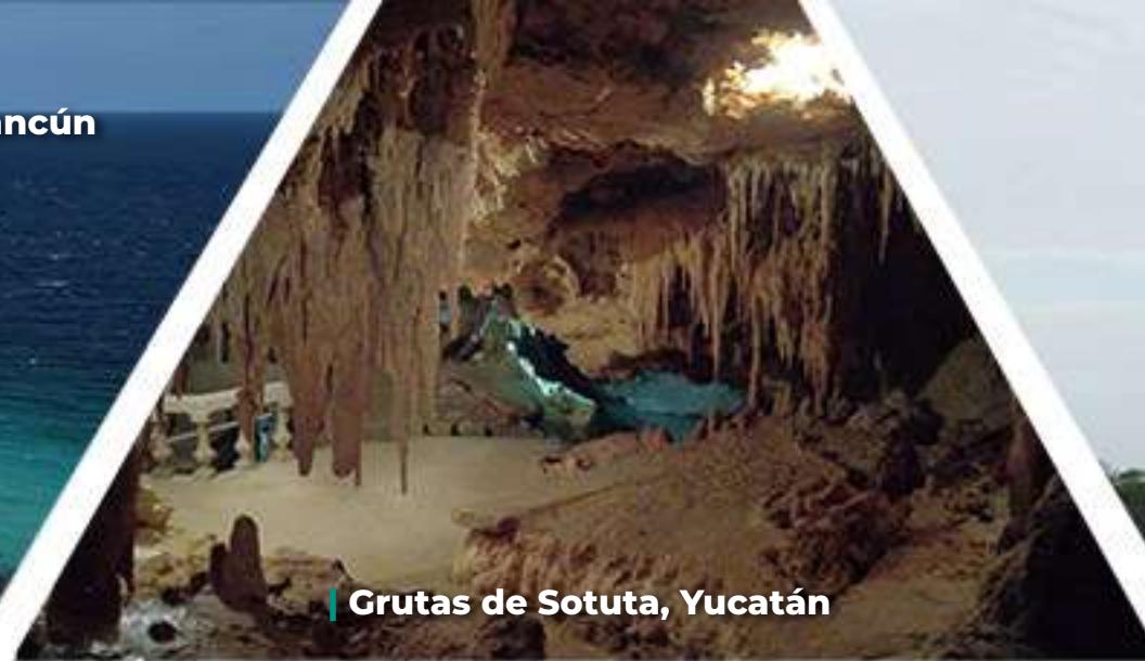
Grutas de Sotuta, Yucatán