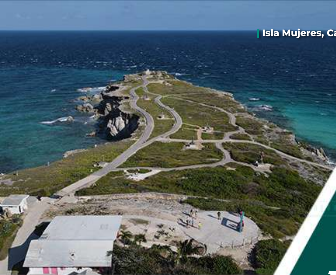
Isla Mujeres, Cancún